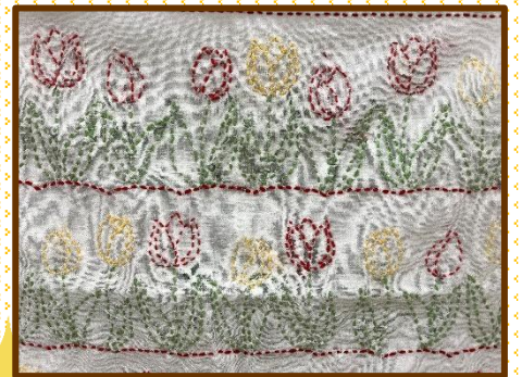
●チューリップの刺繍●